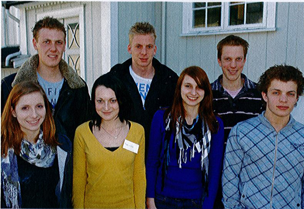
Skolen har for tiden besøk av syv utvekslings elever fra Østerrike og Nederland som jobber med entreprenørprosjekt.

eller Saggrenda en stund, kunne de komme hit og få kurs i for eksempel bioenergi. Vi har blant annet Lena Fjernvarme på stedet her og Energi-gården i nærheten som vi kan benytte.